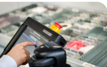
Vertikální skladovací systém - Modula.