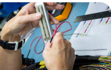
Montáž kabelových svazků.