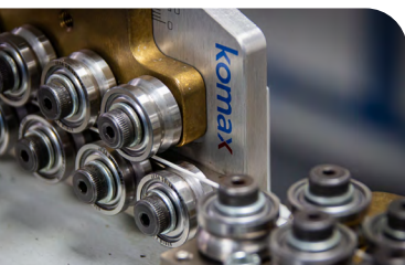
Krimpování drátů - Komax.