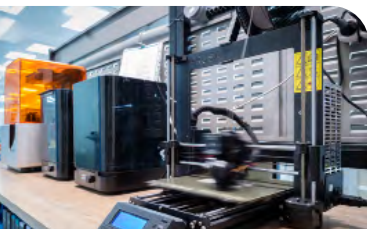
3D tisk modelů.

V dnešní době Pickering Connect nadále vyrábí klasické kabely pro sesterskou společnost Pickering Interfaces. Kromě toho však nabízí zákazníkům možnost navrhnout si složitý kabelový svazek přímo na míru pomocí naší webové aplikace pro návrh kabelů.