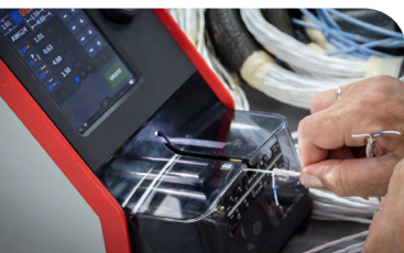
Odizolování drátů - Komax.

Pickering v České republice v roce 2005 začal s výrobou kabeláže a příslušenství k produktům, které vyrábí Pickering Interfaces. V průběhu let se výroba rozrůstala a stále více přibývalo kabelů vyrobených přímo na zakázku. Z tohoto důvodu v roce 2014 vzniká nová samostatná divize Pickering Connect s.r.o.